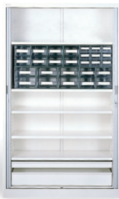
Armario para dispositivos médicos