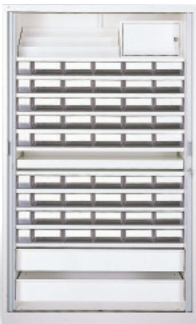
Armario para larga estancia para una gestión nominativa de los 45 residentes