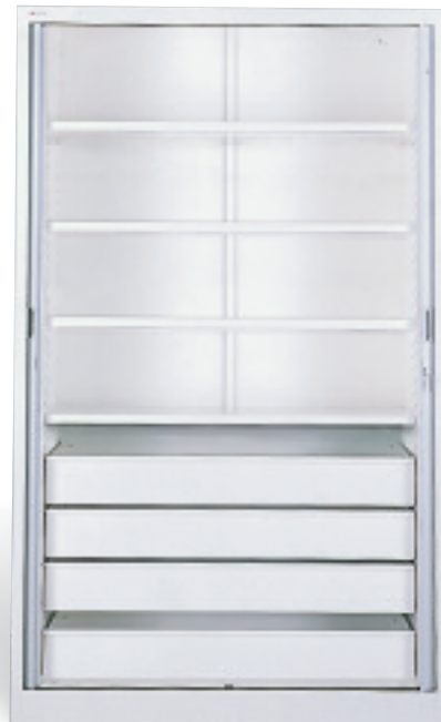
Armario de solutos