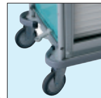
Chasis reforzado con mando centralizado mediante pedal de las 2 ruedas servo.