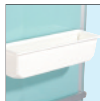
5 - Casillero de almacenamiento (28063N)