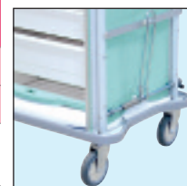
Opción ensamblaje para armario de traslado