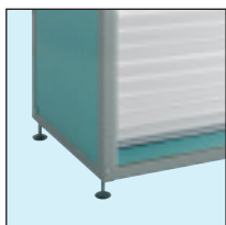
4 pies de cilindro de fijación regulables