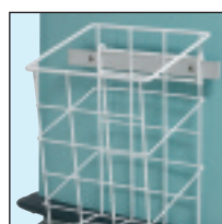
1 - Soporte bolsa de basura simple (28071N)