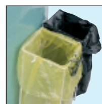
2 - Soporte bolsa de basura doble (28072N)