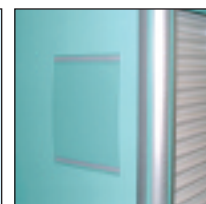
6 - Porta-etiqueta para identificación armario (28000)