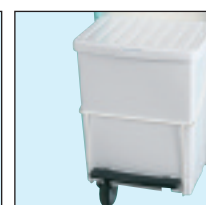
3 - Basura porta bolsa con tapa y pedal (28074N)