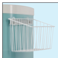
4 - Cesta de alambre (28061N y 28062N)